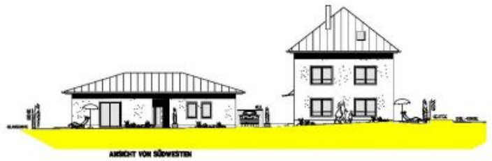
Ansicht Südwest (rechtes Wohnhaus)